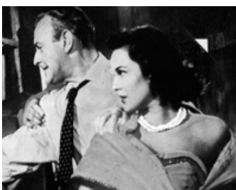
1956 MEURTRES À MIAMI (Miami Expose) de Fred F. Sears avec Patricia Medina