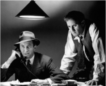
1948 APPELEZ NORD 777 (Call Northside 777) de Henry Hathaway avec James Stewart