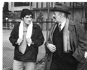
1973 L'EXORCISTE (Teh Exorcist) de William Friedkin avec Jason Miller