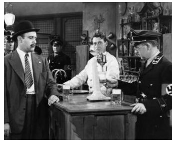
1942 PARIS CALLING (Paris Calling) d'Edwin Marin avec Charles Hardt