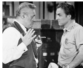
1969 ON N'ACHÈTE PAS LE SILENCE (The Liberation of L.B. Jones) de W. Wyler avec Anthony Zerbe