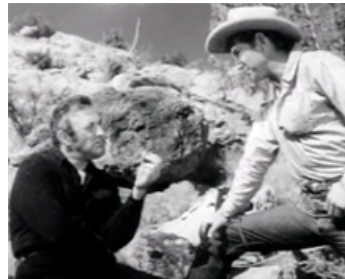
1952 LES DÉMONS DU TEXAS (The tall Texan) d'Elmo Williams avec Lloyd Bridges