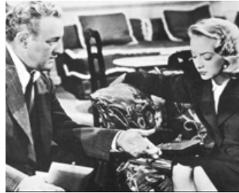
1946 L'HEURE DU CRIME (Johnny O'Clock) de Robert Rossen avec Ellen Drew