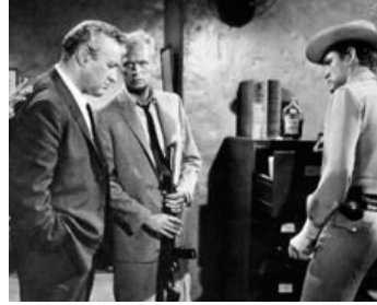
1958 DANS LA SOURICIÈRE (The Trap) de Norman Panama avec Richard Widmark