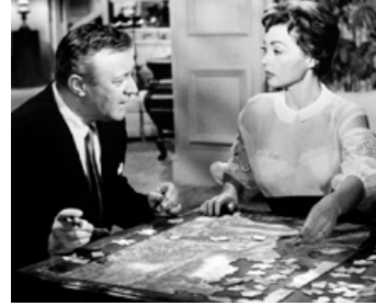
1959 LA VIE À PLEINE DENTS (But not for me) de Walter Lang avec Lilli Palmer