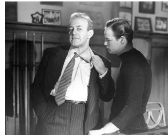
1954 SUR LES QUAIS (On the Waterfront) d'Elia Kazan avec Marlon Brando