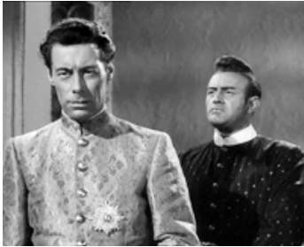
1946 ANNA ET LE ROI DE SIAM (Anna and the King of Siam) de J. Cromwell avec Rex Harrison