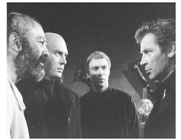
1958 LES FRÈRES KARMAZOV de Richard Brooks avec Yul Brynner, Richard Basehart