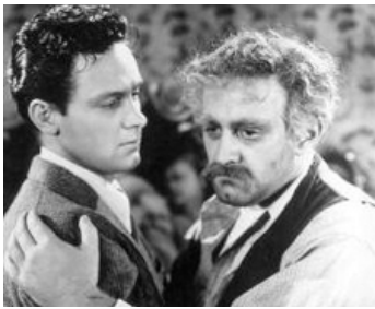
1939 L'ESCLAVE AUX MAINS D'OR (The Golden Boy) de R. Mamoulian avec William Holden