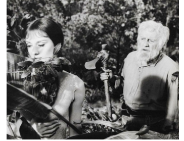
1959 VERTES DEMEURURES (Green Mansions) de Mel Ferrer avec Audrey Hepburn