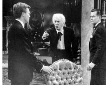
1961 LES 4 CAVALIERS DE L'APOCALYPSE de V. Minnelli avec Karl Heinz Boehm, Glenn Ford