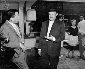
1963 T'ES PLUS DANS LA COURSE, PAPA (Come blow your horn) de B. Yorkin avec Frank Sinatra