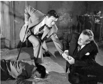
1958 TRAQUENARD (Party Girl) de Nicholas Ray avec Robert Taylor