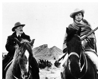
1972 LE FANTÔME DE CAT DANCING (... Cat Dancin) de Richard C. Sarafian avec G. Hamilton