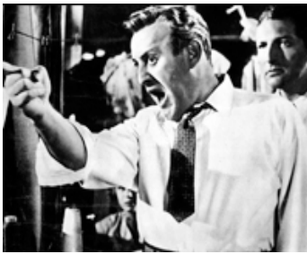
1957 RACKET DANS LA COUTURE (The Garment Jungle) de Vincent Sherman