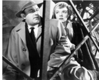
1950 THE MAN WHO CHEATED HIMSELF de Felix Feist avec Jane Wyatt