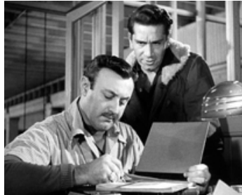
1949 LES BAS-FONDS DE FRISCO (Thieves Highway) de Jules Dassin avec Richard Conte