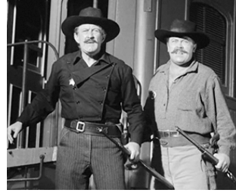
1962 LA CONQUÊTE DE L'OUEST (How West was won) d'H. Hathaway avec Mickey Shaughnessy