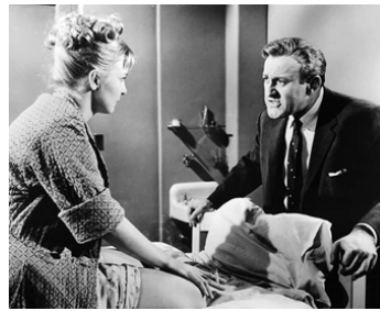
1957 LES TROIS VISAGES D'ÈVE (The three Faces of Eve) de N. Johnson avec J. Woodward