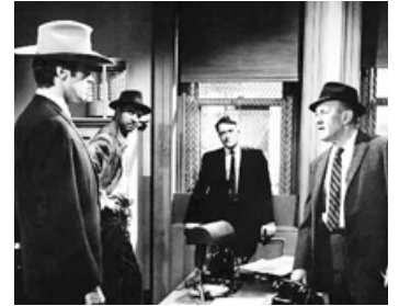
1968 UN SHÉRIF À NEW YORK (Coogan's Bluff) de Don Siegel avec Clint Eastwood