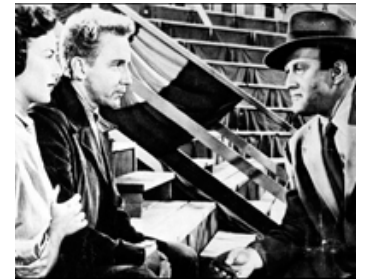
1954 PANIQUE SUR LA VILLE (Gorilla at Large) d'H. Jones avec A. Brancroft, Cameron Mitchell