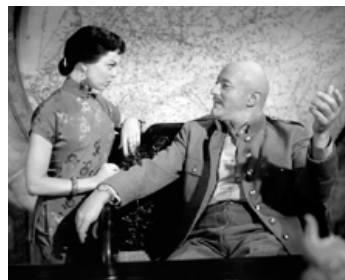
1955 LA MAIN GAUCHE DU SEIGNEUR (The left Hand of God) d'E. Dmytryk avec Jean Porter