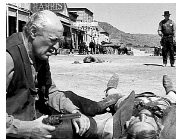
1971 L'HOMME DE LOI (The Lawman) de Michael Winner avec Burt Lancaster