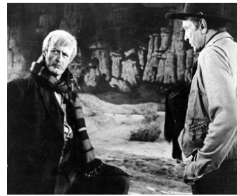
1958 L'HOMME DE L'OUEST (The Man of the West) d'Anthony Mann avec Gary Cooper