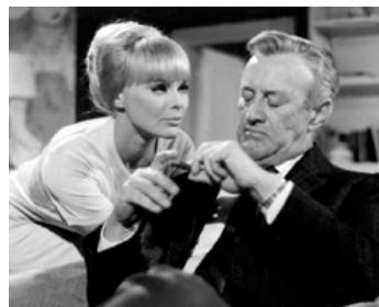
1969 LES HOMMES DE LAS VEGAS (Las Vegas 300 Millions) de Isasi avec Elke Sommer