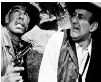
1971 2 SALOPARDS DANS L'OUEST (The meanest Men of the West) de S. Fuller avec Lee Marvin