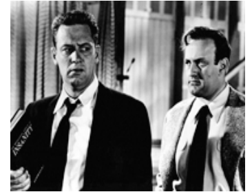
1948 LA FIN D'UN TUEUR (The dark Past) de Rudoph Maté avec William Holden