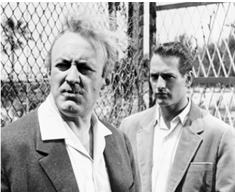
1960 EXODUS (Exodus) d'Otto Preminger, tournage avec P. Newman et Eva-Marie Saint