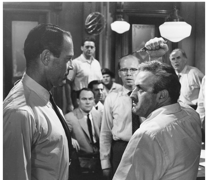
1957 DOUZE HOMMES EN COLÈRE (Twelve angry Men) de Sidney Lumet avec Henry Fonda, E. G. Marshall, Jack Klugman, Ed Binns, Ed Begley