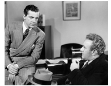
1946 BOOMERANG (Boomerang) d'Elia Kazan avec Dana Andrews