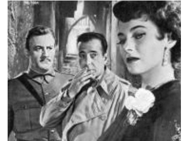
1951 SIROCCO (Sirocco) de Curtis Bernhardt avec Humphrey Bogart, Martha Toren