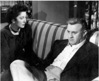
1951 LE POIDS DU REMORDS (The Family Secret) de Henry Levin avec Ruth Roman