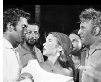
1947 CAPITAINE DE CASTILLE (Captain from Castille) de H. King avec Tyrone Power, Jean Peters