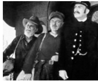
1943 LA FRONTIÈRE SAUVAGE (The Buckskin Frontier) de Lesley Selander avec A. Dekker