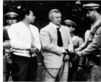
1967 LA MAFIA FAIT LA LOI (Il giorno della civetta) de Damiano Damiani