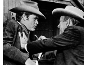
1963 VENGEANCE FINALE (Final Hour) de Robert Douglas avec Doug McClure