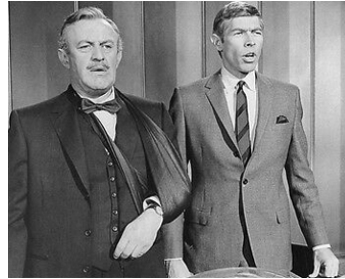
1965 NOTRE HOMME FLINT (Our Man Flint) de Daniel Mann avec James Coburn