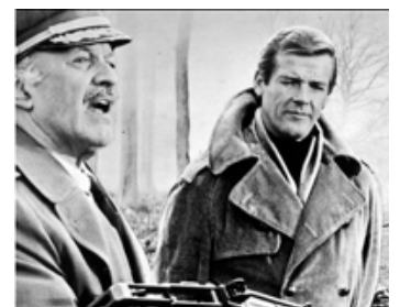
1975 LE VEINARD (The Lucky Touch) de Christopher Miles avec Roger Moore