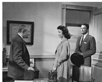
1956 L'HOMME AU COMPLET GRIS de Nunnally Johnson avec Jennifer Jones, Gregory Peck